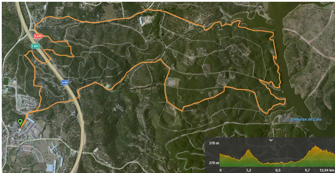
Ilustración 1: Prueba corta del II CxM de El Ronquillo.

La entrega de trofeos será a las 13:00 horas en dicha Plaza.